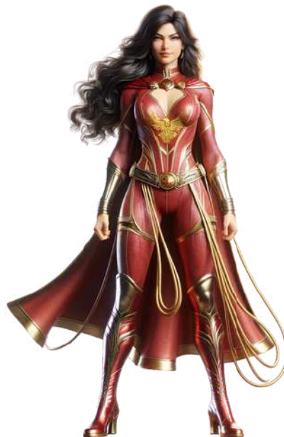
DIVA DA JUSTIÇA