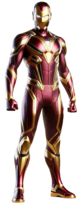
PUNHO DE FERRO