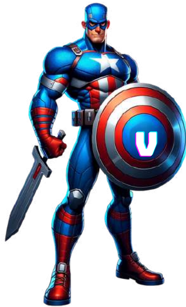
VINGADOR DA AMÉRICA